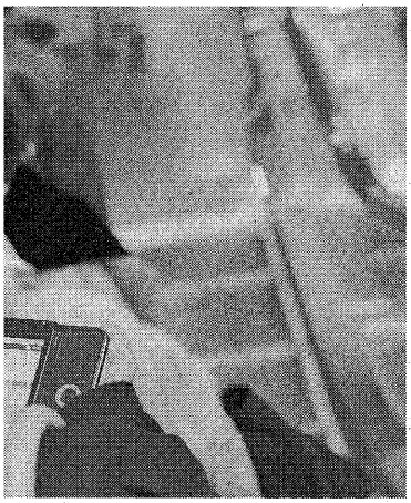
長っている間も携帯電話を市内の駅